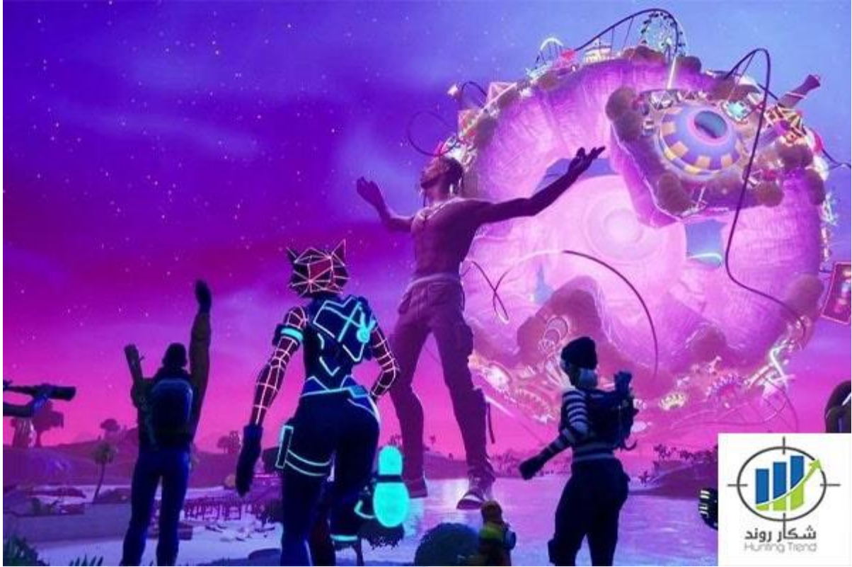
Metaverse ارز دیجیتال