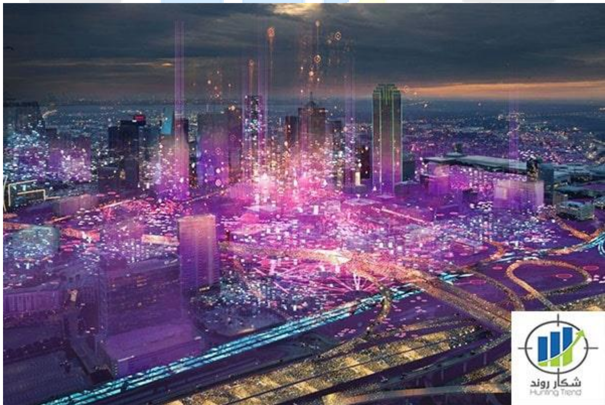
ارزهای دیجیتال متاورس

حال سوال اصلی این است که در پاسخ به سوال متاورس چیست؟ می گوئیم که متاورس یک دنیای جدید و مجازی است، منظور ما از دنیا چیست؟ پاسخ به این سوال می تواند ویژگی های جالبی از متاورس را به ما نشان دهد.